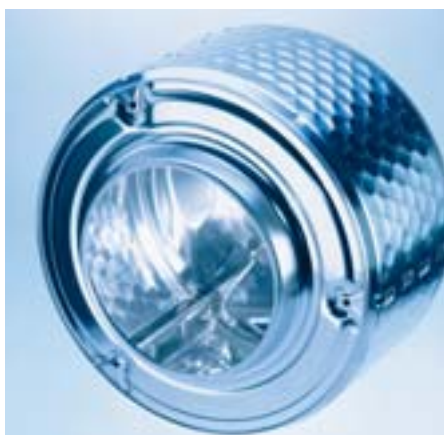
Tambor patenteado com estrutura de favos (lavagem)