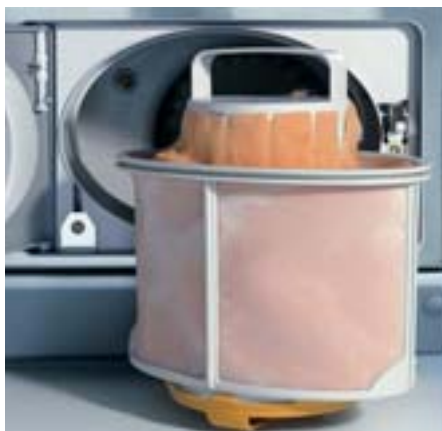
Filtro de grande capacidade no novo secador