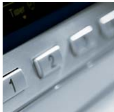
Teclas selectoras directas