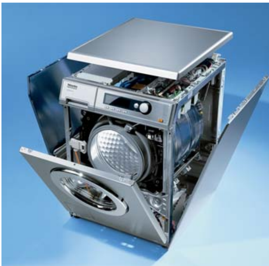
PW 6065 PLUS