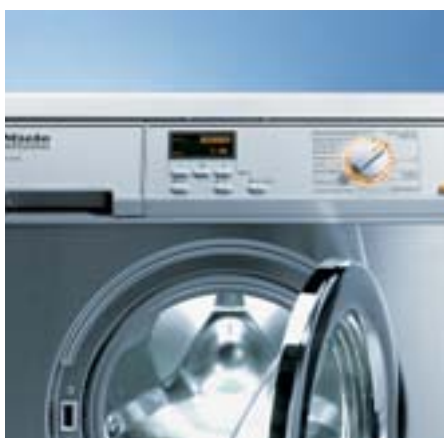
Comando MULTITRONIC L