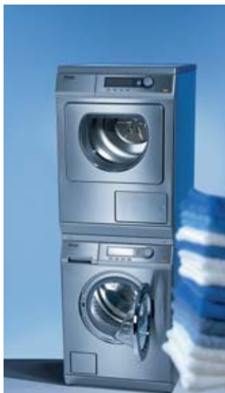
Tambor Estrutura de Favos patentado dos Pequenos Gigantes Miele PW 6065 PLUS e PT 7136 PLUS