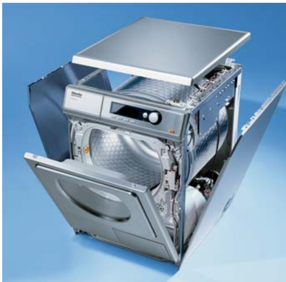
PT 7136 PLUS